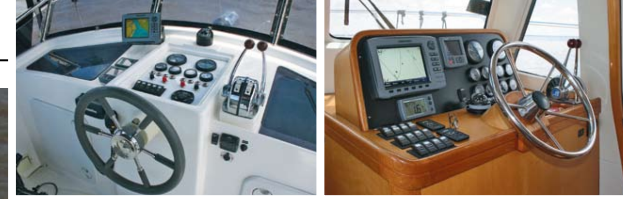
El Marco Polo 42 en pleno planeo, donde se puede apreciar su amplio sector de flybridge. Arriba: tablero de mando de fly y, a la derecha, el tablero de mando interior.